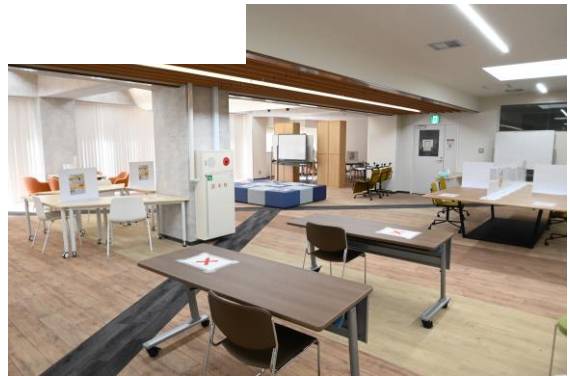
ダイバーシティエリア 室内